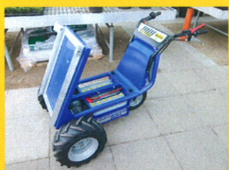
Kippmechanismus mit R&S-Schnellwechselsystem