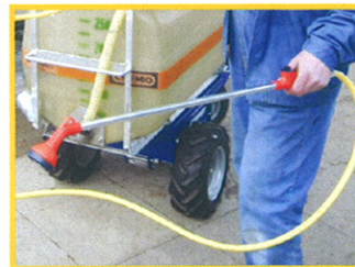
praktisches Detail: die Bewässerungslanze