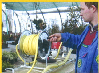
die Schlauchtrommel gibt zusätzliche Bewegungsfreiheit

Das Bewässerungsmodul ist autark und effizient : Die Honda Frischwasser(motor)pumpe sorgt für eine hohe Pumpleistung. Schlauchtrommel und Bewässerungslanze erhöhen den Aktionsradius und erleichtern die Arbeit. Der Tank lässt sich durch das R&S-Schnellwechselsystem mit wenigen Handgriffen abbauen und durch andere Aufbauten ersetzen.