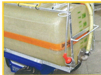
eine Halterung für die Bewässerungslanze