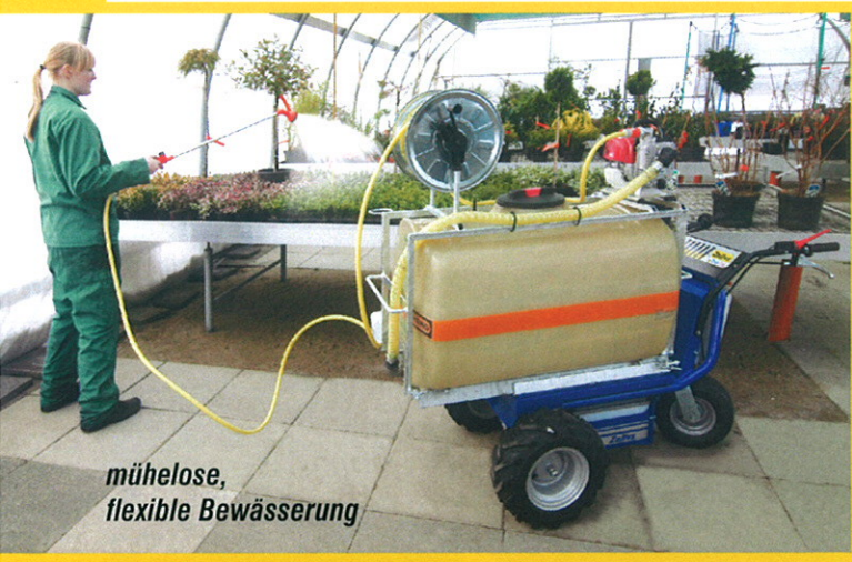
mühelose, flexible Bewässerung

Der „Zallys D 1“ mit dem aufgebauten 300-Liter-Wasserfass ergibt eine wendige und mobile Bewässerungseinheit. Enge, ansteigende und abfallende Wege bis zu 30% sind kein Problem für den Elektro-Dumper. Der kraftvolle Elektroträger (mit Rückwärtsgang) rangiert die Last leicht auf engstem Raum mit dem um 360° drehbaren Stützenrad.