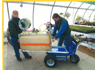
...Abbau des kompletten Bewässerungsmoduls...