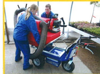
...und mit neuem Gerät (hier: Motorsauger) aufgebaut