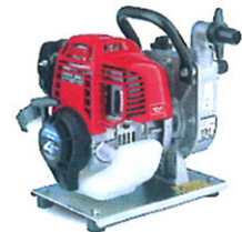
Honda Frischwasser(motor)pumpe WX 10 Technische Daten: