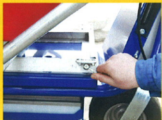
in Sekundenschnelle entriegelt...